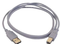
Cable de transmisión, terminado con conector USB