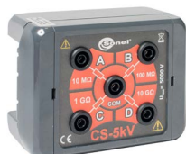
Adaptador caja de calibración 5 kV

WAPRZ003REBB10K WAPRZ005REBB10K WAPRZ010REBB10K WAPRZ020REBB10K