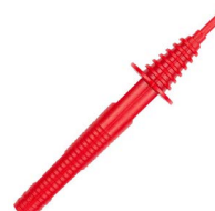
Sonda roja de punta 11 kV (toma tipo banana)